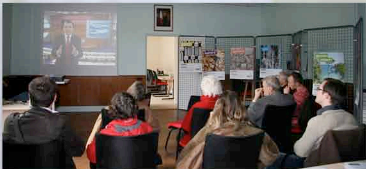
Projection de documentaire le 4 avril