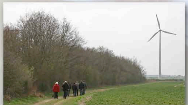
Visite du site des éoliennes