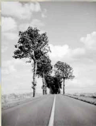
«Polaroïd Passion» par Bertrand Nicolas